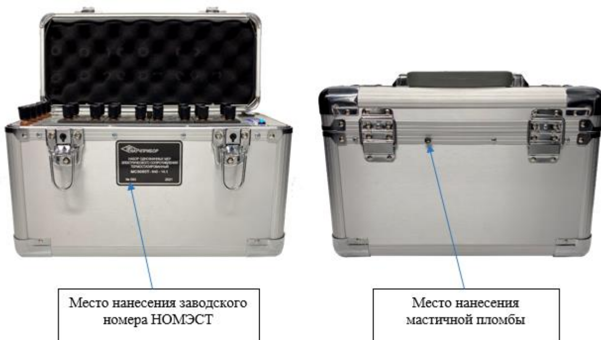
Рисунок 8 - Общий вид передней и задней панелей НОМЭСТ модификации MC3050T-6 с указанием места нанесения заводского номера и места пломбировки от несанкционированного доступа