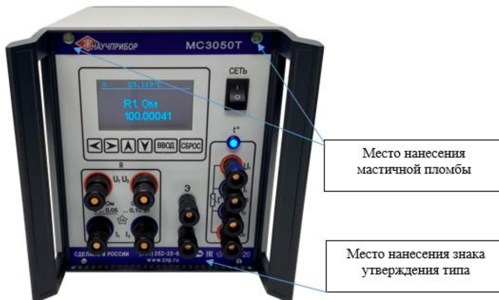
Рисунок 3 - Общий вид НОМЭСТ модификации MC3050T-5 с указанием мест пломбировки от несанкционированного доступа, места нанесения знака утверждения типа