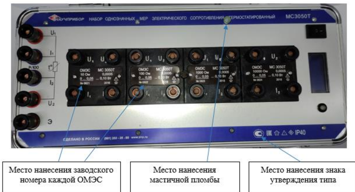
Рисунок 7 - Общий вид верхней (лицевой) панели НОМЭСТ модификации MC3050T-6, с указанием мест пломбировки от несанкционированного доступа, мест нанесения заводского номера ОМЭС и знака утверждения типа