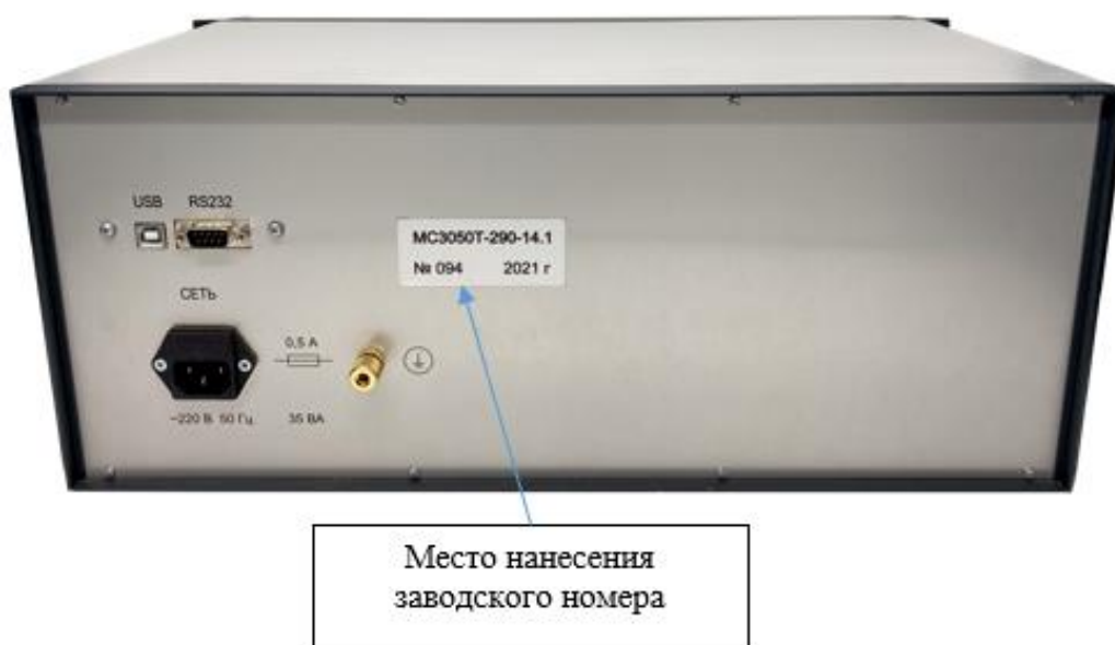
Рисунок 4 - Общий вид задней панели НОМЭСТ модификаций MC3050T-1, MC3050T-2, MC3050T-3, MC3050T-4, MC3050T-5 с указанием места нанесения заводского номера