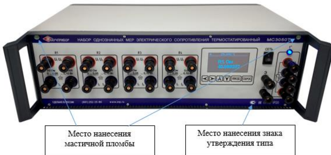
Рисунок 2 - Общий вид НОМЭСТ модификаций MC3050T-3, MC3050T-4 с указанием мест пломбировки от несанкционированного доступа, места нанесения знака утверждения типа (на примере модификации MC3050T-3)