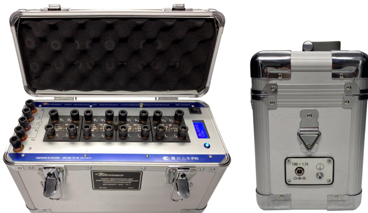
Рисунок 6 - Общий вид НОМЭСТ и боковых панелей НОМЭСТ модификации МС3050Т-6