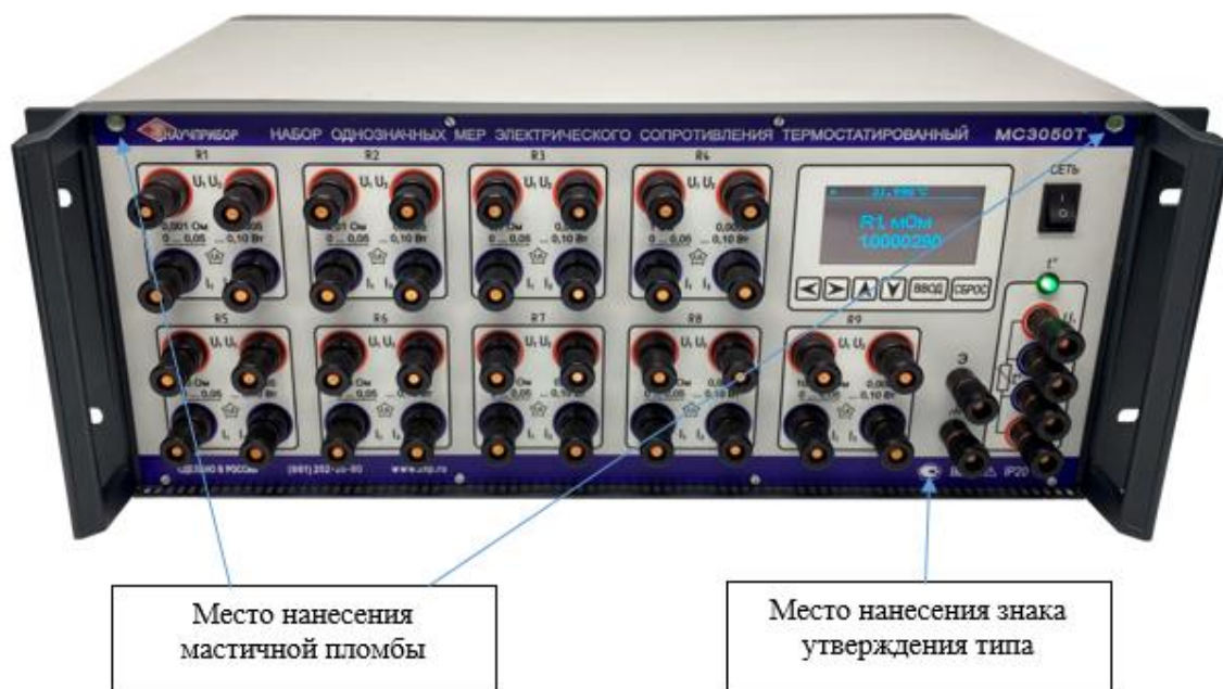
Рисунок 1 - Общий вид НОМЭСТ модификаций MC3050T-1, MC3050T-2 с указанием мест пломбировки от несанкционированного доступа, места нанесения знака утверждения типа (на примере модификации MC3050T-2)