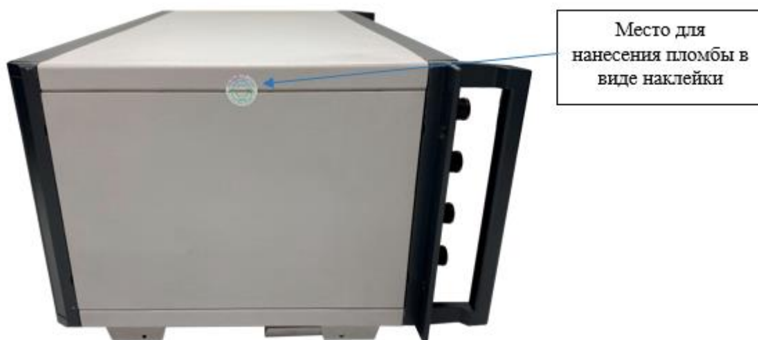
Рисунок 5 - Общий вид боковой панели НОМЭСТ модификаций МС3050Т-1, МС3050Т-2, МС3050Т-3, МС3050Т-4, МС3050Т-5 с указанием мест пломбировки от несанкционированного доступа (на примере модификации МС3050Т-2)